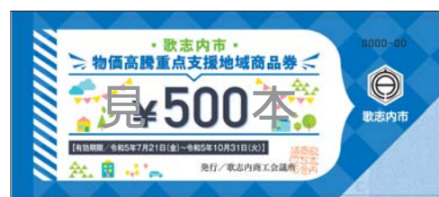
▲郵送される地域商品券のデザイン