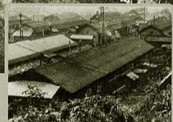
⑭神威神楽岡の炭住