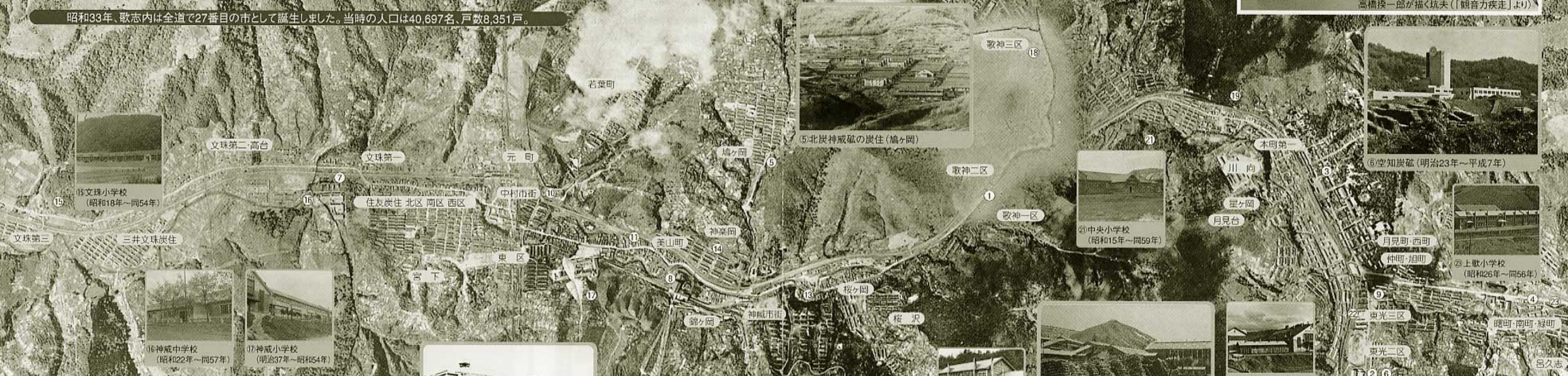
昭和33年、歌志内は全道で27番目の市として誕生しました。当時の人口は40,697名、戸数8,351戸。