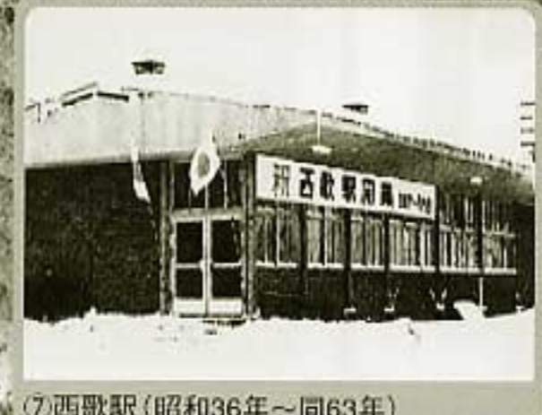
⑦西歌駅 (昭和36年～同63年)