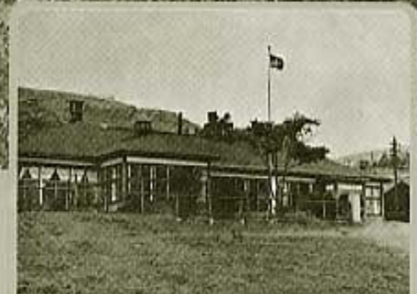
⑩住友歌志内砒 (明治38年～昭和46年)