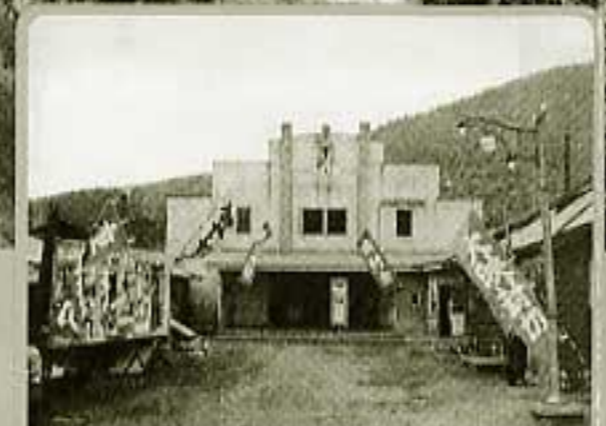
⑪松竹座 (昭和13年～同37年)