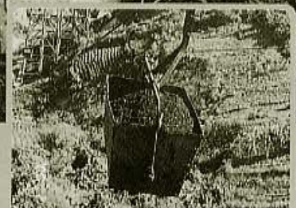
⑫幸袋砒業 (昭和32年～38年)