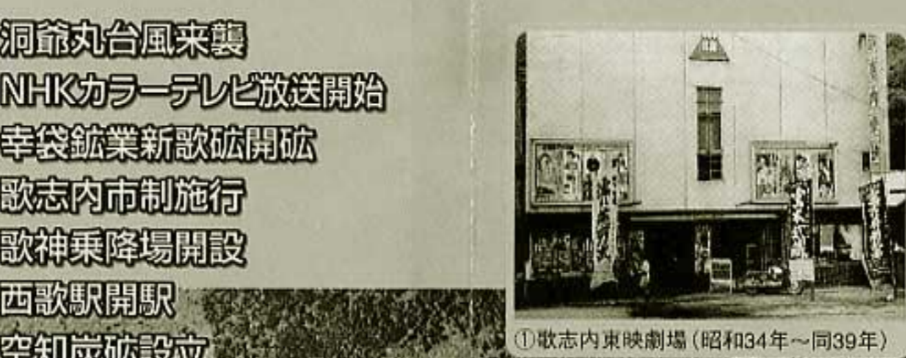
①歌志内東映劇場 (昭和34年～同39年)