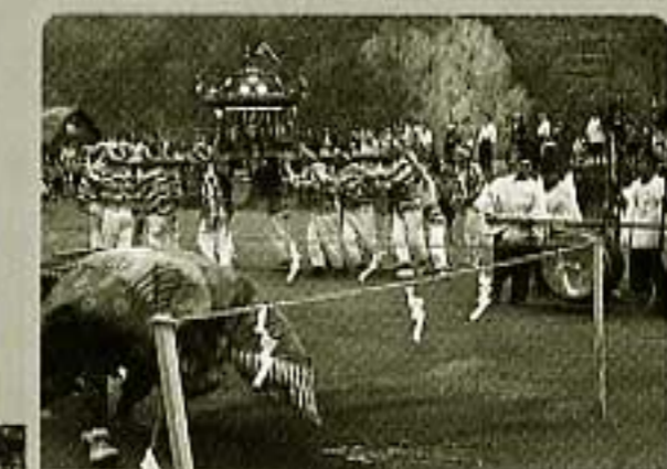
②炭砒まつり (空知炭砒)