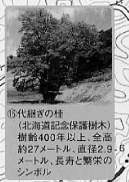
15代継ぎの桂 (北海道記念保護樹木) 樹齢400年以上、全高約27メートル、直径29.6メートル、長寿と繁栄のシンボル