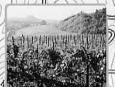
18ワイン用ぶどう畑 露頭炭採掘跡地を利用し「うたしないワイン」用ぶどうを栽培