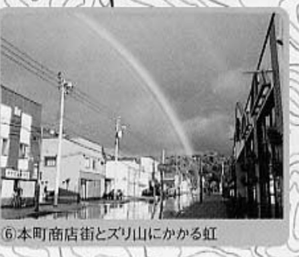
6本町商店街とスリ山にかかる虹