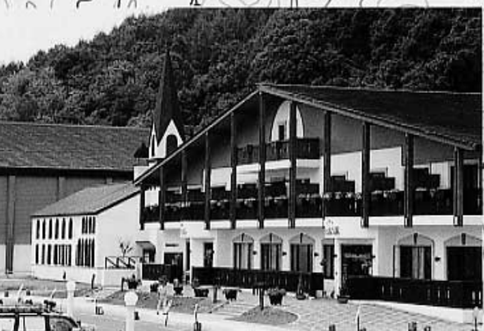
10チロルの湯 露天風呂、サウナ完備 ●入浴料/大人500円 ●小人300円 AM10:00~PM10:00 ●宿泊/13室 ●TEL0125-42-5588