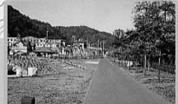
14サイクリングロード JR歌志内線踏跡地などを東西に縦断