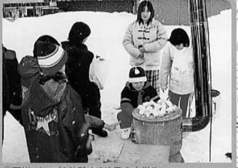
11石炭ストーブを体験する地元の小学生 石油ストーブ世代の子どもたちが生まれて初めて石炭を燃やしました(郷土館)