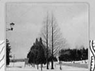
19石炭の木(メタセコイア) 幼木が平成10年、植樹されました。