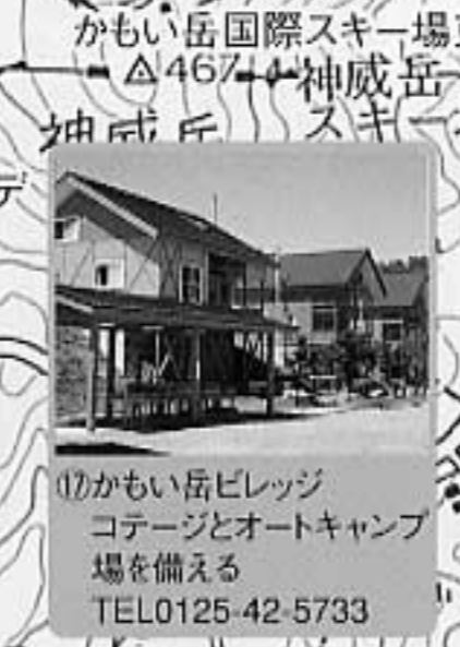
17かもい岳ビレッジ コテージとオートキャンプ場を備える TEL0125-42-5733