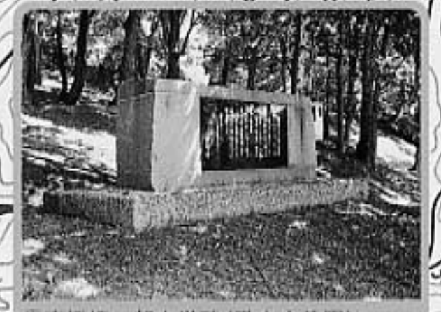
③高橋一郎文学碑(歌志内公園) 郷土出身の芥川賞作家の碑がマチを見おろす(平成5年建立)