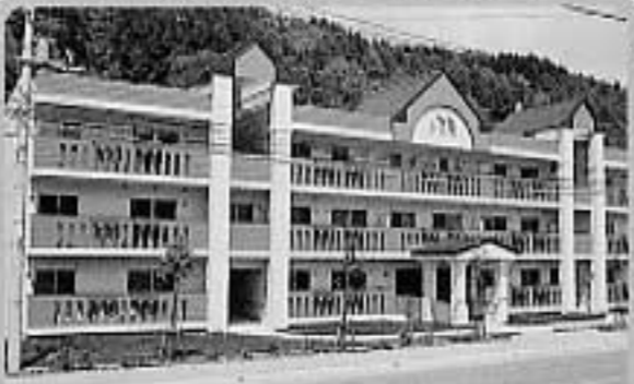
12文珠高台団地公営住宅(平成8年~)

パソコン紙芝居 西小学校の児童が、パソコンを使い郷土の昔ばなしに新たな息吹を与えました。 ・三戸のキツネ~人をばかすのが上手なキツネのはなし ・源さんとイタチ~小遣いかせぎのイタチ採りがかえって周囲を心配させるはなし 問い合わせ/西小学校 TEL42-2041