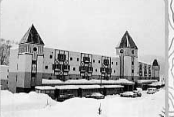
16東光地区改良住宅(平成8年~)