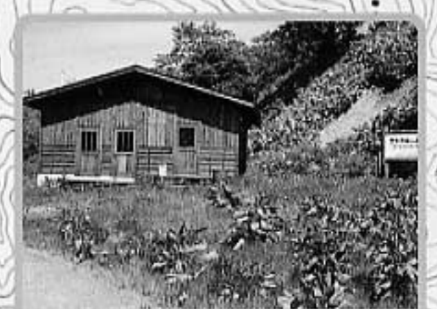
⑨ニングルの森 ロマン座裏手からすぐの散策路