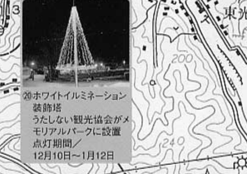
20ホワイトイルミネーション 装飾塔 うたしない観光協会がメモリアルパークに設置 点灯期間/12月10日~1月12日