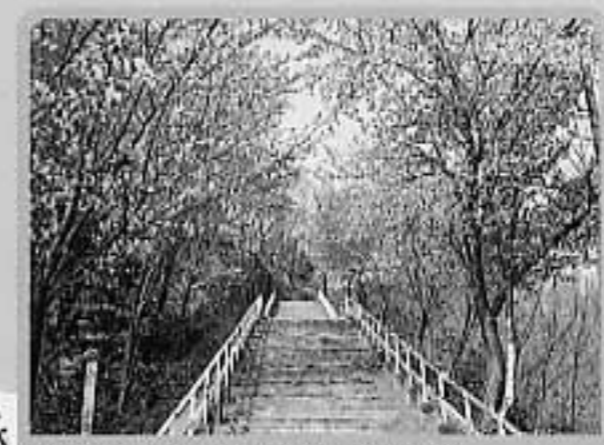
②歌志内桜まつり(歌志内公園)