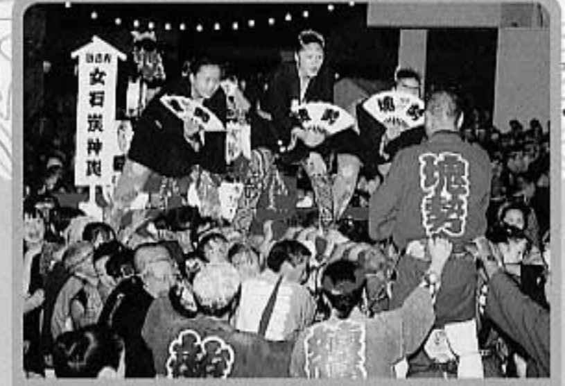
しょってけ祭り 重さ1トンの石炭塊をかつく勇壮なみこしが見もの 開催/7月第2土曜 会場/公民館広場