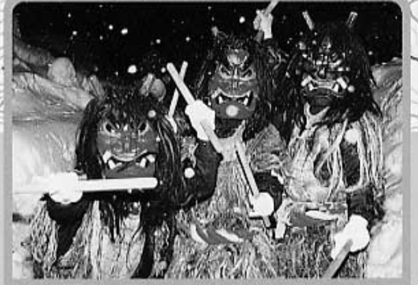
なまはげ祭り マチを景気づけようと、昭和61年から始まり冬の行事として定着しました。 開催/1月最終日曜 会場/公民館広場