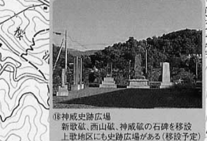
18神威史跡広場 新歌砦、西山砦、神威砦の石碑を移設 上歌地区にも史跡広場がある(移設予定)