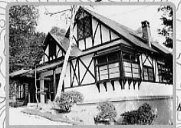
⑤こもれびの杜記念館(旧知炭鉱倶楽部) 入館無料 月曜ほか休館 AM9:00~PM5:00 (開館時期5月~10月)