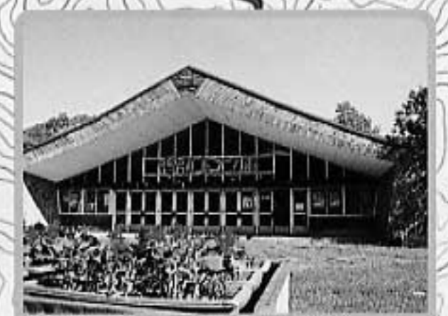
⑦悲別口マン座(旧住友上歌会館) 昭和59年ドラマ「昨日、悲別で」のロケに使われた映画館跡(営業期間5~10月)