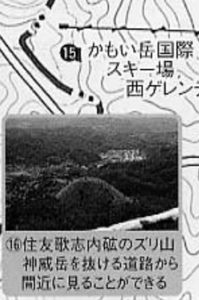
16住友歌志内砦のスリ山 神威岳を抜ける道路から間近に見ることができる