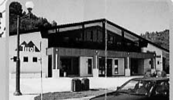
13道の駅 うたしないチロルの湯 無休 AM10:00~PM7:00(ショップ) TEL0125-42-5566