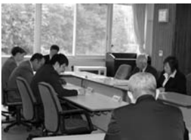
↑行政常任委員会の様子