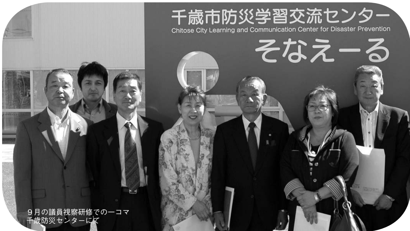
9月の議員視察研修での一コマ 千歳防災センターにて