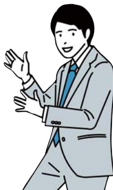
<社会教育グループ>

普及などを行うため、共同互助会である北海道市町村職員福祉協会と連携し、各種事業を実施しています。職員互助会の状況は、表7のとおりです。