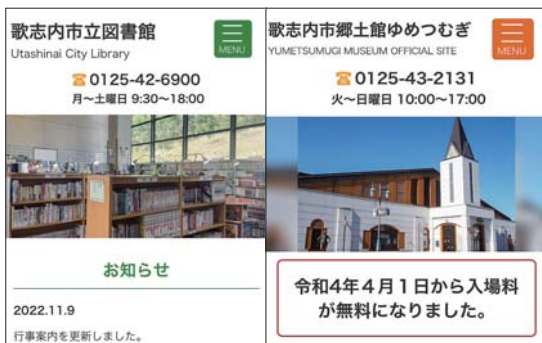
▲ホームページのトップ画面イメージ（スマートフォン）