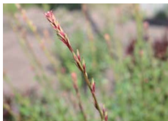
▲歌志内学園前花壇