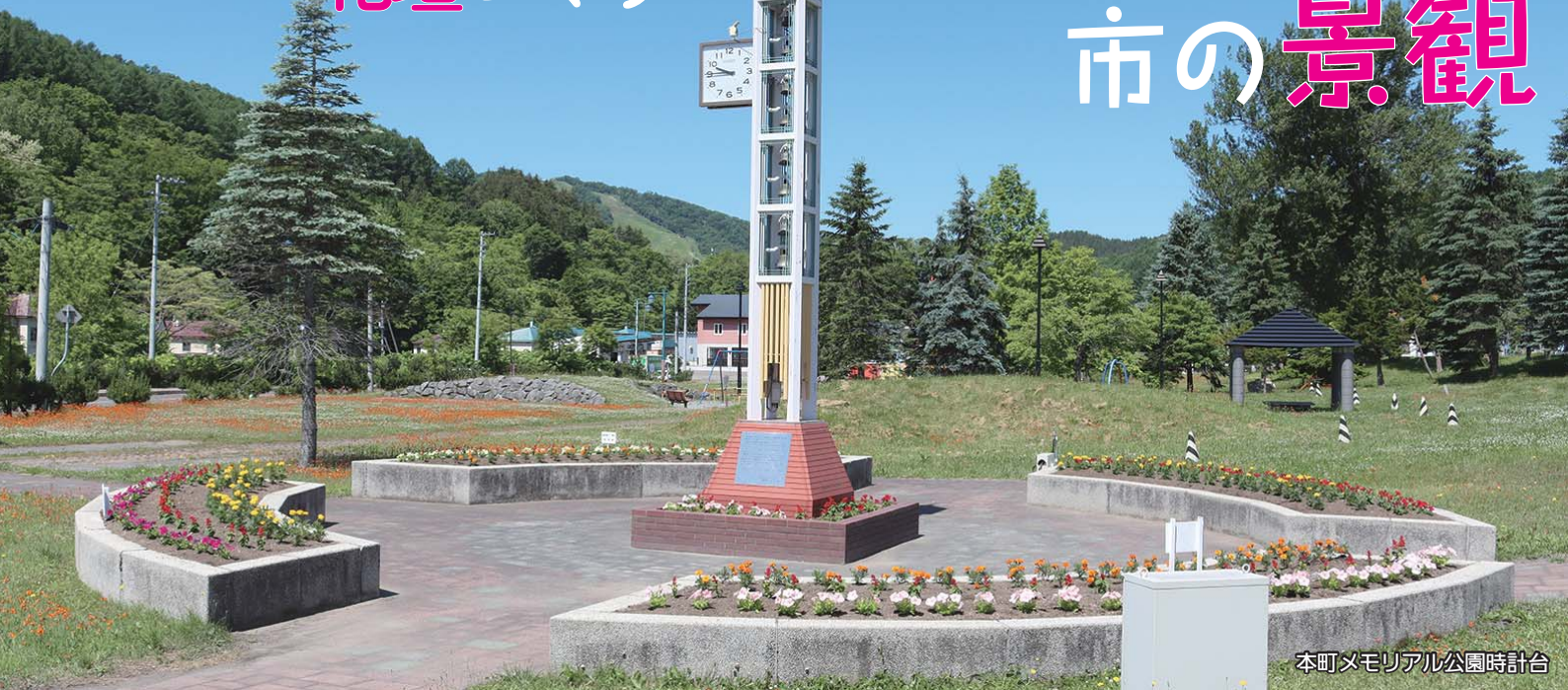
本町メモリアル公園時計台

今、市内の各所できれいなお花を植える動きが広がっています。コロナ禍真っ只中の令和3年5月、医療や福祉施設などの従事者に対する感謝とエールを送ろうと、医療サービスのシンボルカラーである「青」の花を町内会連合会と商工会議所、市が共同で主催して植栽したことをきっかけに、毎年市内4か所の花壇（歌志内学園前花壇、文珠チロルの湯看板前花壇、道の駅前花壇、本町メモリアル公園花壇）できれいなお花が育てられています。今年もそれぞれ花壇に植栽や手入れがされ、色とりどりの花が道道沿いを彩っています。