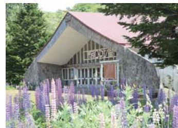
▲悲別ロマン座花壇