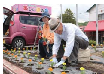
▲市内バス停付近やうたみん花壇