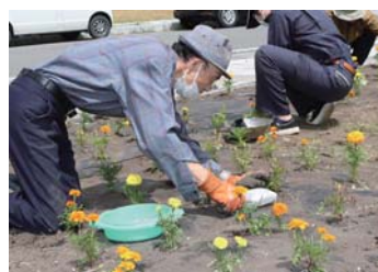
▲文珠チロルの湯看板前花壇