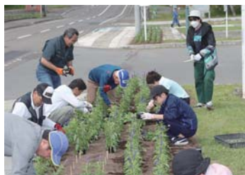
▲道の駅入り口花壇