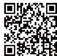
▲今後の雪 (気象庁HP) QRコード