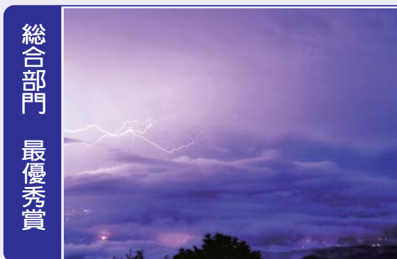
総合部門 最優秀賞