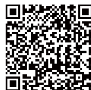
▲北海道の積雪状況 QRコード

气象台が発表する大雪警報や、大雪に関する気象情報、今後の雪の予想などをホームページで公開していますので、これらの情報を活用し大雪に備えましょう。