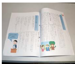
▲生徒が作成した広報誌「歌志内を魅る」