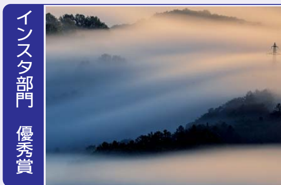
インスタ部門 優秀賞