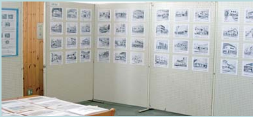
▲中山教道氏のまちかどスケッチ展示のようす

動画の配信は、YouTube検索で「きてみない？うたしないち」で本市地域おこし協力隊員の公式チャンネル ( https://www.youtube.com/channel/UCLWghdZZ7ISO_xn4DcwIROg ) より、ご覧になれます。