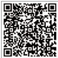
警報・注意報 QRコード