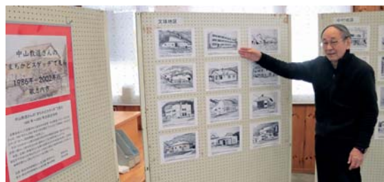
▲懐かしい歌志内の風景をぜひご覧ください。