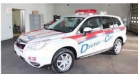
砂川市立病院「ドクターカー」※医師、看護師が乗車

救急現場で重症な方や救急隊のみでは搬送までに時間がかかる場合は、「指揮広報車」を出勤させ救急隊を増員する場合があります。