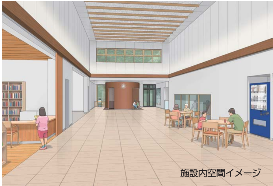
施設内空間イメージ

児童センター等一元化施設は、安全で安心して集うことができる「子どもの居場所」と「地域交流の拠点」として、本市にとって将来とも、多くの市民が利用できる施設として建設されます。これまで、着実に進めてきた財政の健全化により実現が可能となり、次世代に負担なく、教育関係者や保護者からの知恵をいただき、ここに至った事業です。どうぞ完成を楽しみにお待ちください。