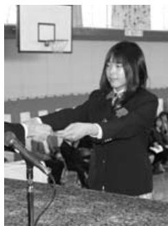
〈歌志内小学校卒業式〉