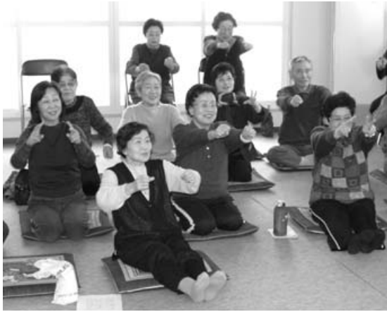
〈介護予防出前講座〉

1月から3月まで全8回にわたり、東光地区の住民を対象とする介護予防出前講座が同地区集会所で開催されました。参加した皆さんは、軽運動やストレッチなどで、楽しみながら転ばないための体づくりをしました。