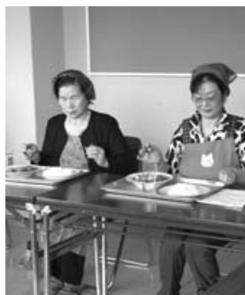
〈北海地鶏のスープカレー教室〉

3月18日、楽生園で地域住民講座が行われ、市民や施設入所者など約100人の皆さんが、楽しい暮らしは心の健康からとする精神保健講習や元気に長生きするための食事を学ぶ栄養講座に耳を傾けました。