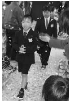
〈保育所発表会・卒園式〉

3月22日、保育所で発表会と卒園式が行われ、発表会で父母等に成長した姿を披露した7人の卒園児たちが、楽しかった保育所を巣立って行きました。