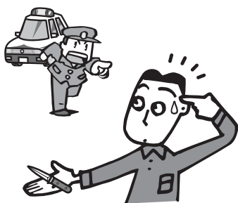
▲期日までにご確認を

7月5日以降、上記に該当する剣を所持していた場合には、3年以下の懲役または50万円以下の罰金となります。使わずにしまい込んでいた刃物についても、今一度ご確認ください。