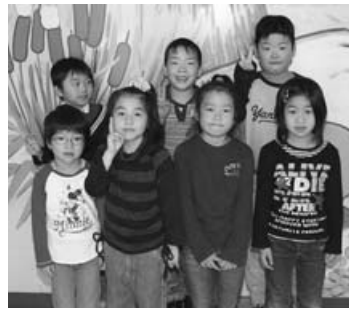
▲小学校入学を楽しみに待つ、歌志内幼稚園(左)と神威保育所(右)に通う子どもたち。

この春、市内の小学校に入学するお子さんは次の26人です(1月末日現在)。お名前がなかったり住所を変更したときは、教育委員会(☎424223)までご連絡ください。