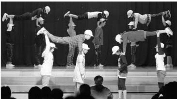
〈西小学校学芸発表会〉

10月16日、神威保育所で避難訓練と防火教室が行われ、園児たちは、しっかりと避難訓練を終わらせたあと、市消防職員の消火器の実演や防火広報ビデオを真剣な表情で見っていました。