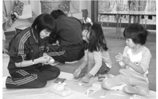
〈歌中3年生保育実習〉

歌志内中学校3年生の家庭科授業の一環として10月9日と同14日、歌志内幼稚園で保育実習が行われました。最初は緊張した様子の生徒たちでしたが、すぐに慣れ、園児たちとの交流を楽しみながら学んでいました。