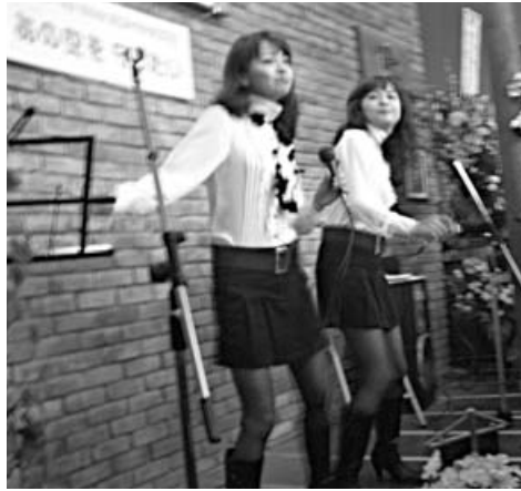
〈「ザ・リリース」ミニコンサート〉

とても活発な子です。最近、物入れの扉を開け閉めしたり、おもちゃなどを口に入れたりと好奇心おう盛です。ただ、お姉ちゃんのおもちゃをとって怒られたりしちゃいますけどね。元気で明るい子になってほしいです。