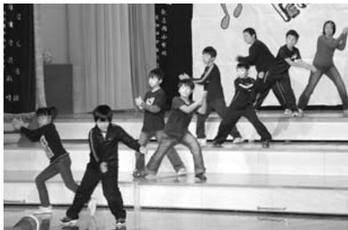
〈歌志内小学校学芸会〉

小学校の学芸会が、10月5日に歌志内小学校で、同12日には西小学校で行われ、児童たちは、遊戯や音楽、劇などをいっしょにうけんめい披露し、その姿に父母たちから暖かい拍手が送られていました。