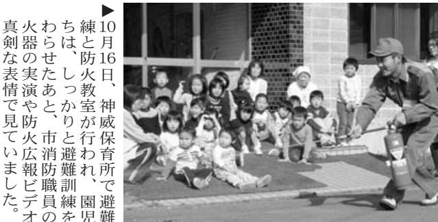
〈神威保育所避難訓練・防火教室〉

10月14日、歌志内中学校全校生徒による学校周辺地域の清掃ボランティア活動が行われ、生徒たちは、市立病院から楽生園までの間のバス停清掃のほか、道沿いやサイクリングロードのごみ拾いに汗を流しました。