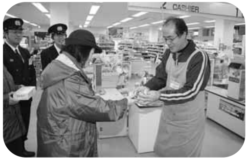
〈女性消防団員歳末防火広報〉

12月15日と16日の2日間、道の駅でクリスマス「サンタとじやんけん大会」が行われ、たくさん子どもたちが、同施設内に設置された全長7メートルのクリスマスツリーの前で、じゃんけんチャレンジしました。