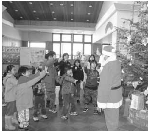
〈道の駅クリスマスイベント〉

わたしのまねをして片言でしゃべったり 引き出しからものを出していたずらしたり、 なんにでも興味を示しはじめ、これからの 成長が楽しみです。自分らしく、真っ直ぐ に育ってほしいと願っています。