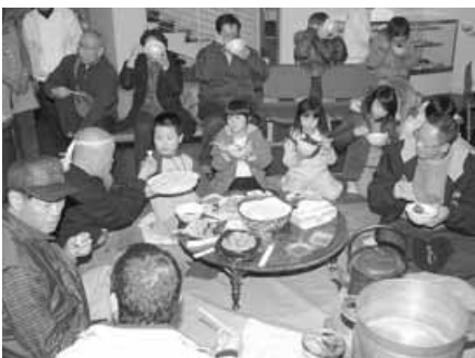
〈炭鉱（ヤマ）のお茶会〉

12月6日、幼稚園でもちつき会が開かれ、園児たちは「よいしよ」の掛け声に合わせてもちつきを行い、でき上がったもちをあんこやごま、納豆など色とりどりの味つけでおいしくいただきました。