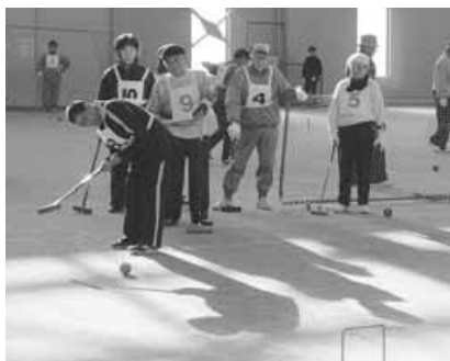
〈ゲートボール大会〉

12月8日、郷土館で炭鉱（ヤマ）のお茶会が開催され、参加者たちは、漬物やおしるこ、お菓子を食べながらちやぶ台を囲み、炭鉱長屋での暮らしぶりなど当時の思い出話に花を咲かせました。