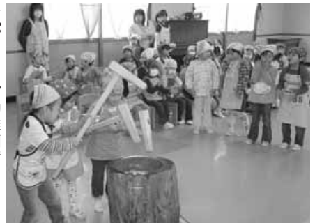
〈幼稚園もちつき会〉

社会福祉施設等への見舞金の資金造成を目的に12月14日、北海道共同募金会歌志内市支会主催の歳末たすけあいボランティアの集いが公民館で開催され、80人の参加者の皆さんが、バンド演奏や抽選会などの催しを楽しみました。