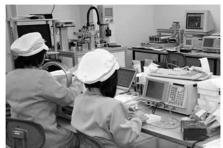
▲製品の検査は、一つひとつ丁寧に手作業で行われています。

えて、新しいタイプの製品製造と小型化、量産に取り組みています。 今回の新装工事では、組み