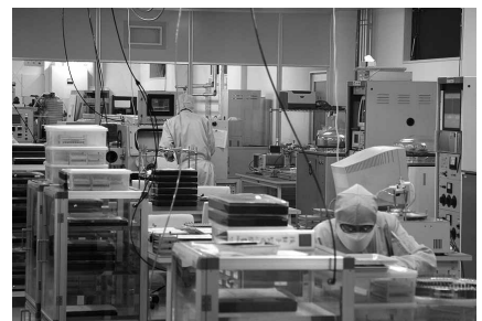
▲最新設備が導入され、同社工場の中核となるクリーンルーム。

テレビなどのデジタル機器の小型化と同じく、水晶部品業界においても、どんどん製品の小型化が進み、価格競争等も厳しくなってきたことから、同社では今後を見据