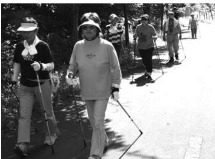
〈ノルディックウォーキング講習会〉

7月21日・25日・28日の3日間、ノルディックウォーキング講習会が開かれ、アーリーナチロルで講師から歩き方、ポイントの使い方等の指導を受け、その後、実際にサイクリングロードをウォーキングしました。