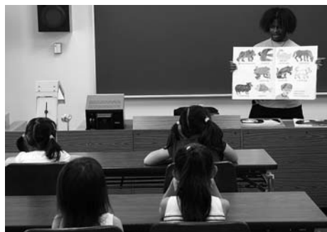
〈チビッコ英会話教室〉

7月21日・25日・28日の3日間、ノルディックウォーキング講習会が開かれ、アーリーナチロルで講師から歩き方、ポイントの使い方等の指導を受け、その後、実際にサイクリングロードをウォーキングしました。