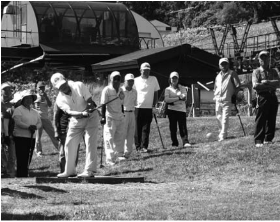
〈市長・議長杯争奪パークゴルフ大会〉

8月13日、かもい岳パークゴルフ場で市長・議長杯争奪パークゴルフ大会が開催され、総勢80人のプレイヤーが、白熱した好ゲームを繰り広げていました。