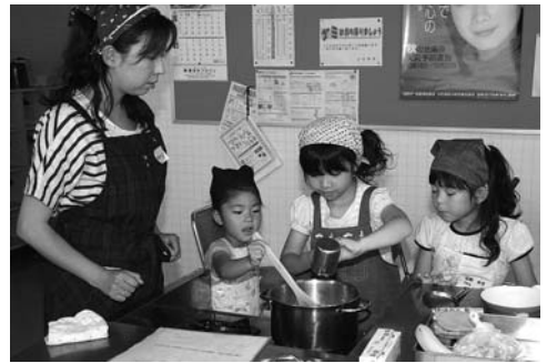
〈親子ふれあい料理教室〉

公民館で7月23日、親子ふれあい料理教室が行われ、子どもたちは、お母さんや食生活推進委員の方といっしょにカレーなどを作り、上手にできた料理をおいしく食べました。