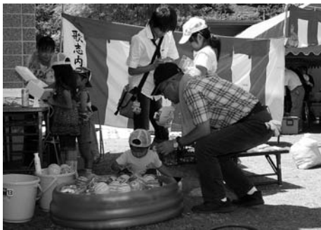
〈文珠第二町内会夏祭り〉

7月24日、文珠第二町内会夏祭りが町内会館裏の広場で行われ、手作りの出店が並んだ会場には、たくさんの方々が訪れ、楽しい1日を過ごし親睦を深めていました。