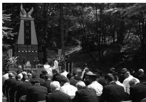
〈歌志内市戦没者顕彰慰霊祭〉

神威保育所なつまつりが7月29日に開催され、浴衣等に替えた子どもたちは、先生たち手作りのゲームや屋台で楽しい夏のひとときを過ごしていました。