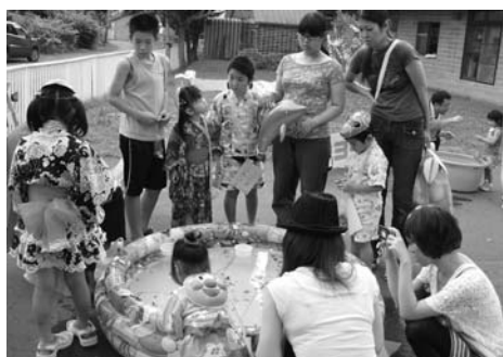
〈神威保育所なつまつり〉

神威保育所なつまつりが7月29日に開催され、浴衣等に替えた子どもたちは、先生たち手作りのゲームや屋台で楽しい夏のひとときを過ごしていました。