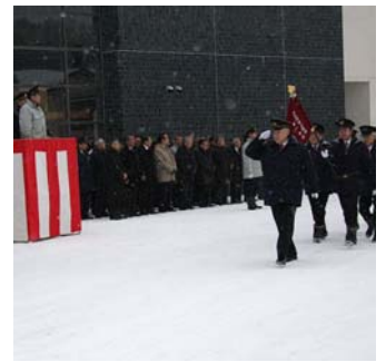
▲昨年の消防出初式。