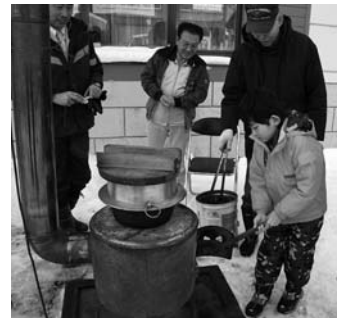
▲昨年のもちつきと昔の冬遊び。