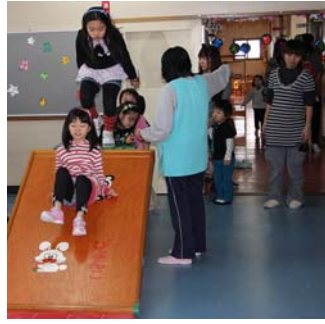
▲昨年の幼稚園一般開放。