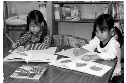
〈図書館チャレンジ教室〉

1月5日から3日間、図書館で自作の絵本作りに取り組み、チャレンジ教室が開かれ、子どもたちは講師のアドバイスを受けながら、それぞれ個性ある絵本を作り上げました。