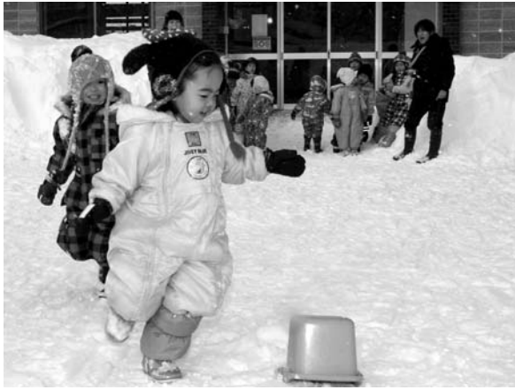
〈神威保育所雪中運動会〉

1月13日、神威保育所前で雪中運動会が行われ、子どもたちは冬の寒さにも負けず、元気いっぱい雪の中で、宝探しゲームやリレーなどの競技を楽しんでいました。