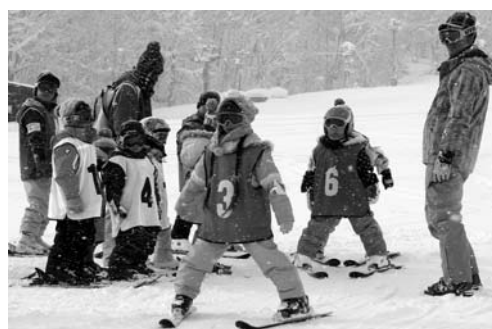
〈子どもスキー教室〉

▶1月10日から3日間、子どもスキー教室がかもい岳スキー場で開催され、集まった子どもたちは熱心にスキーの練習をして、最後は全員がリフトに乗ってゲレンデを滑れるようになった。