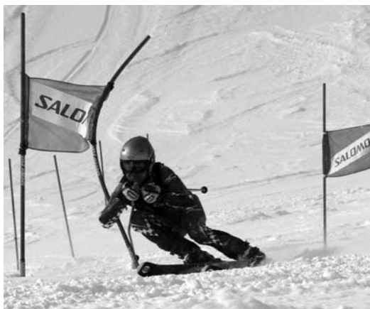
〈サロモンカップかもい岳ジュニアスキー大会〉

▲サロモンカップかもい岳ジュニアスキー大会が1月3日から3日間、かもい岳スキー場で開かれ、延べ約950人の小中学生の選手たちは、10分の1秒を競い合いました。