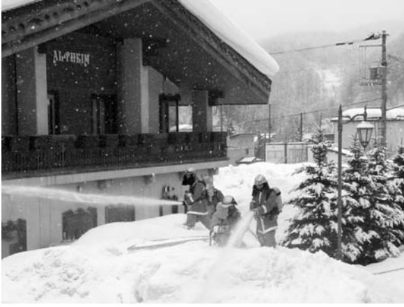
〈消防記念日出動放水訓練〉

消防記念日となる3月7日、本町地区で出動放水訓練が行われ、消防職員は火災を想定し、出火通報を受け現場に駆けつけ連携を図りながら本番さながらの訓練を行いました。