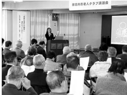
〈老人クラブ講話会〉

消防記念日となる3月7日、本町地区で出動放水訓練が行われ、消防職員は火災を想定し、出火通報を受け現場に駆けつけ連携を図りながら本番さながらの訓練を行いました。