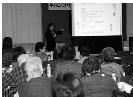
〈ボランティア研修会〉

2月25日、歌志内中学校の生徒4人が「自分たちで何かの窓や玄関などに積もった雪を除去するボランティアにしてみました。」と、自ら幼稚園で