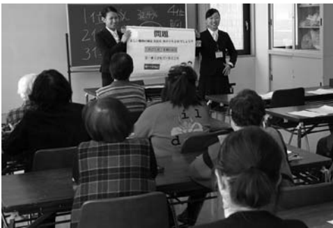
〈食生活改善推進員研修会〉

3月7日、公民館で高齢者健康教室が開催され、参加したかたがたは、自宅で体力づくりできる簡単な方法や、高齢者でも楽しく行える優しい体操を学んでいました。