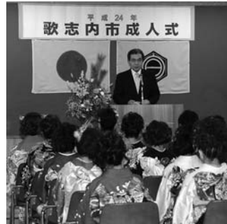
▲前回行われた成人式の様子。

市内に住民登録のない方も出席できます。また、市内に住民登録のある方には教育委員会から案内状を発送しますが、届かない方は、社会教育グループ(教育委員会 ☎42~4223)へご連絡ください。