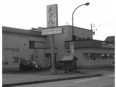
▲ サービス付き高齢者向け住宅

その他 入居等に関するお問い合わせは、(有)ケアサポート21 ☎ 42-3565 まで