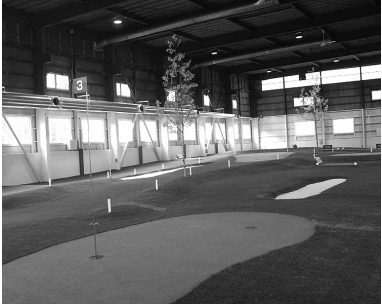
▲ 室内パークゴルフ場

その他 営業時間等に関するお問い合わせは、(株)藤樹園 ☎ 42-5589 まで