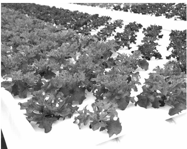
▲ 水耕栽培された葉野菜

その他 営業時間等に関するお問い合わせは、(株)藤樹園 ☎ 42-5589 まで