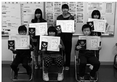
▲作文コンクールで入賞された児童の皆さん