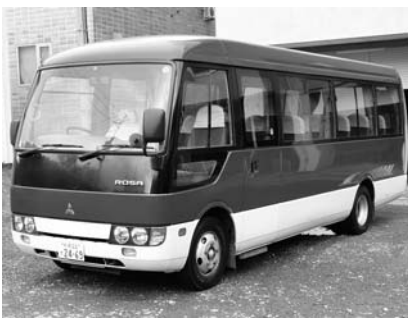
〈競売する市公用車（マイクロバス）〉

▼申し込み期限 12月25日（火） ▼申し込み先 財政管財グループ（市役所2階 ☎ 423214）