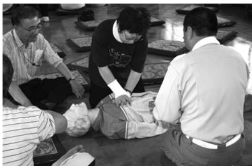
〈文珠第二町内会 A E D 講習会〉

歌志内幼稚園で5月27日、歌志内市防火安全協会主催による防火花壇の植栽が行われ、園児たちは、きれいな花が咲くように願いを込めて苗を植えました。