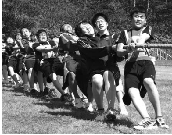
(歌志内中学校体育大会)

食欲旺盛で、病気知らずなのでこのまま健康で、人にやさしくできる子に育ってほしいですね。