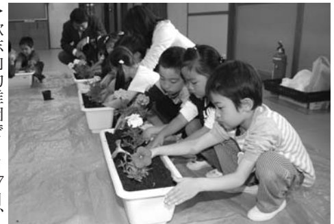
〈歌志内幼稚園防火花壇植栽〉

6月13日、平成22年度の歌志内市消防演習が行われ、郷土館前を分列行進した後、会場を公民館に移してロープレスキューや一斉放水訓練を行いました。