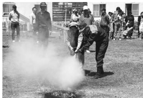
〈本町中央・川向町内会消火訓練〉

6月15日、文珠第二町内会で A E D の講習会が開催されました。参加した皆さんは、救急時における人工呼吸法や心肺蘇生法などを学びました。