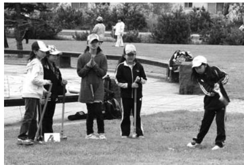
(市民ミニゴルフ大会)

6月5日、メモリアルパークで市民スポーツ・ミニゴルフ大会が開催されました。参加した57人の皆さんは、ポストレィを目指し和気あいあいとしてプレイを楽しみました。