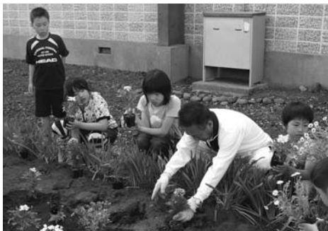
(神威児童センター花壇植栽)

6月7日、神威町内会ボランティアの皆さんが、神威児童センターを利用して、児童センターにある花壇に色とりどりの花を植栽しました。