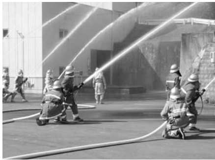
〈平成22年度歌志内市消防演習〉

5月22日・23日の2日間、道の駅チロルの湯で、第4回うたしないチロル春祭りが開催されました。大食い選手権では、男女別に選ばれた皆さんがたこ焼きを制限時間内で何皿食べられるかを競い合い、会場を沸かせていました。