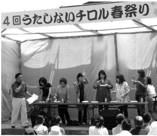
〈第4回うたしないチロル春祭り〉

5月22日・23日の2日間、道の駅チロルの湯で、第4回うたしないチロル春祭りが開催されました。大食い選手権では、男女別に選ばれた皆さんがたこ焼きを制限時間内で何皿食べられるかを競い合い、会場を沸かせていました。