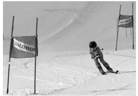
〈サロモンカップかもい岳ジュニアスキー大会〉

1月3日から3日間、かもい岳スキー場でサロモンカップい岳ジュニアスキー大会が開催され、全国から延べ約80人の小・中学生が各競技7種目で100分の1秒を競いました。