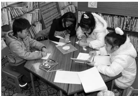
〈図書館チャレンジ教室〉

12月26日から3日間、図書館でチャレンジ教室が開催され、参加した子どもたちはオリジナルの絵本づくりに挑戦し、自由な発想で思い思いの絵本を作り上げました。