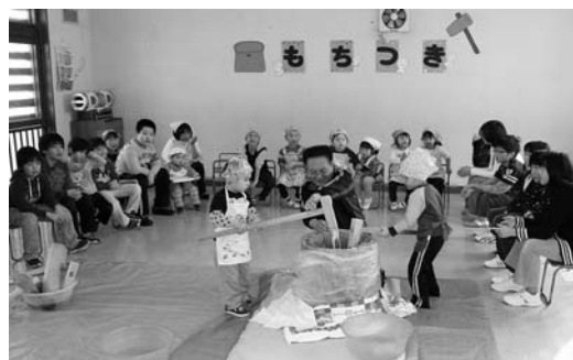
〈地域交流もちつき会〉

▶1月11日、神威保育所で地域交流もちつき会が行われ、小学生や神威町内会のかたが、が保育所を訪れ、子どもたちがといつしよに楽しくもちつきをしました。