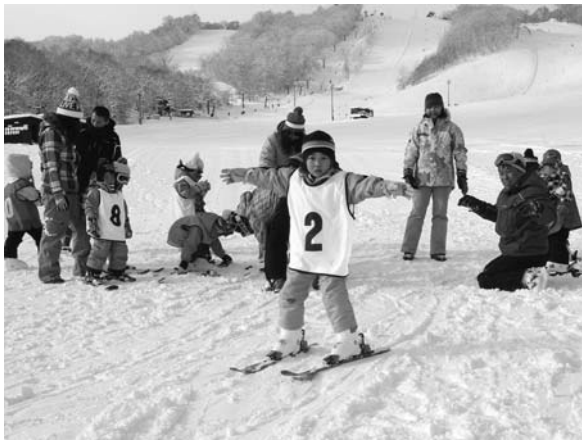
〈子どもスキー教室〉