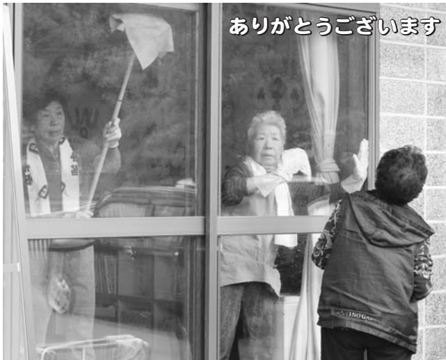
～日赤奉仕団窓ふきボランティア～ ▲手の届かない場所まできれいにしていただき、園児たちは「ありがとうございました!」とお礼を言いました。(7月3日 神威保育所)