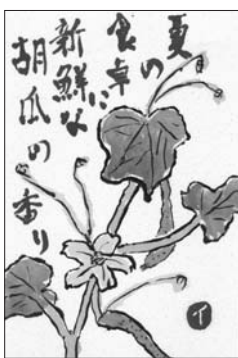
田村 イサ 「収穫」