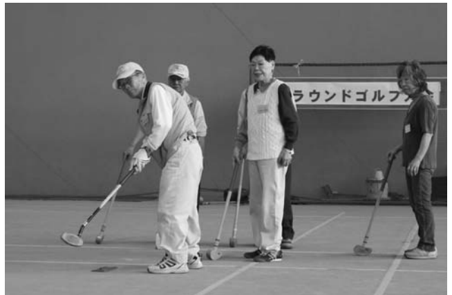
～高齢者グラウンドゴルフ大会～ ▲日ごろ練習をしている方も今回が初めての方も一緒に楽しみながら、スコアを競いあいました。(6月26日 アリーナチロル)