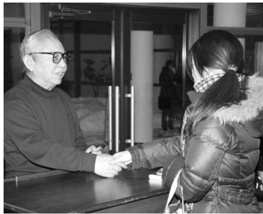
〈谷は眠っていた 作・演出家の倉本聰氏〉

いつも家の中を歩き回ったり、外を散歩したりと、とても元気にしています。家の中ではシール遊びが大好きで、シールを貼ったりはがしたりして遊べる絵本が特に気に入ります。少し甘えん坊ですが、このまま愛嬌のあるやさしい子になってほしいですね。