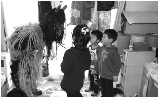
〈神威保育所の様子〉

1月28日、公民館でお父さんの料理学校が開催されました。この日の献立は和食料理で、参加したみなさんは、手際よく調理を進め、お昼に苦労したところなどの感想を話しながら味わいました。