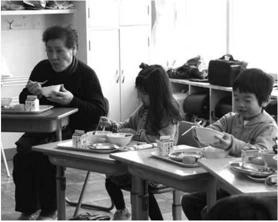
〈学校給食週間：漬物提供〉

1月29日、地元特産品の漬物を市内小中学生に食べてもらうと、道の駅から「七福神漬け」がプレゼントされました。子どもたちは、給食のカレーライスと一緒においしそうに食べていました。