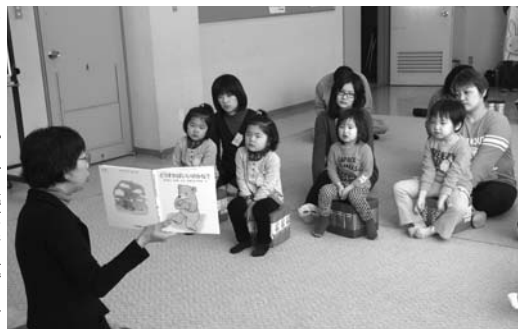
〈絵本の読み聞かせ〉

2月11日、公民館で富良野ROUPによる「谷は眠っていた」の公演が行われました。市内外から訪れた約650人の観客の皆さんは、出演者の熱のこもった演技に感動の拍手を送っていました。