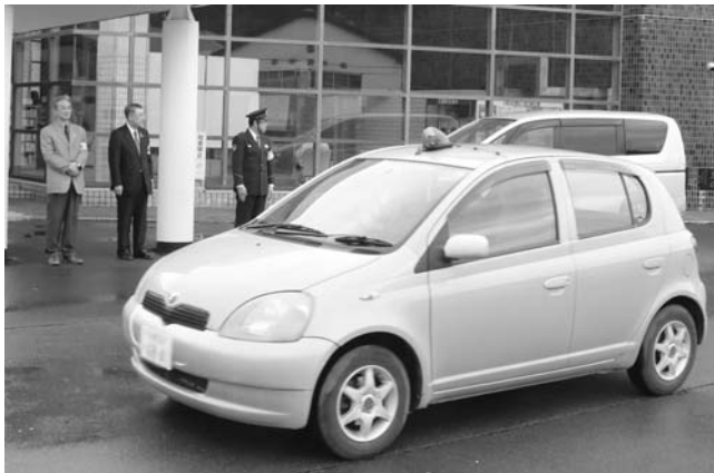
～地域安全運動出動式～ ▲春の地域安全運動の実施に伴い、警察車両と青色回転灯装備車両による市内パトロールが行われました。(5月11日 うたみん駐車場)

※このコーナーは、市内のでき事をご紹介しているコーナーです。広報紙に掲載した写真を無料で差し上げますので、ご希望の方はご連絡ください。 ■連絡先 企画財政課企画広報グループ（市役所3階 ☎42～3214）