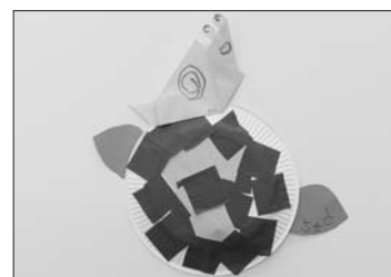
紙工作「あじさい」 きむら さきと