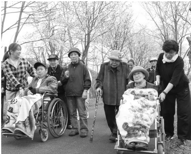
～お花見～デイ・サービスセンター ▲気持ち良い春の空気を感じながら、サイクリングロードに咲いた満開の桜を眺め楽しみました。(5月6日 文珠地区)