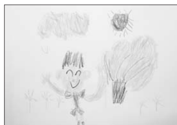
「さくらをみにいしば でかけたよれんと」