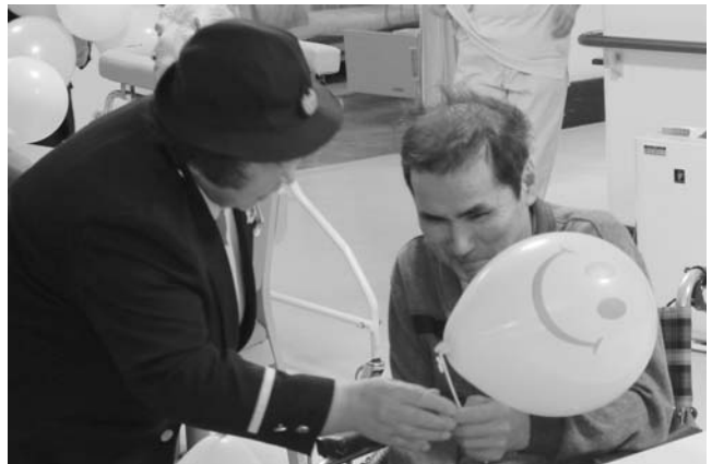
～婦人防火クラブしらかば荘訪問～防火啓発 ▲歌志内市婦人防火クラブがしらかば荘を訪れ、風船やティッシュを手渡し、火災予防を呼びかけました。(4月28日 しらかば荘)