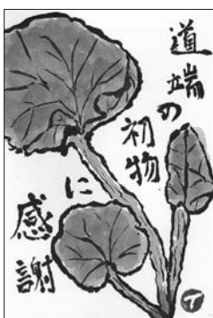
「季節の恵み」 田村 イサ