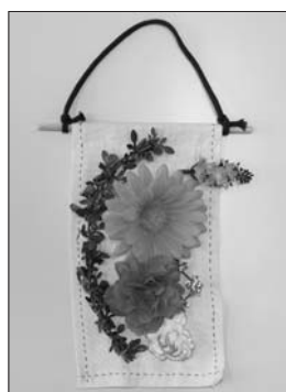
西澤 ミサ 「壁飾り」