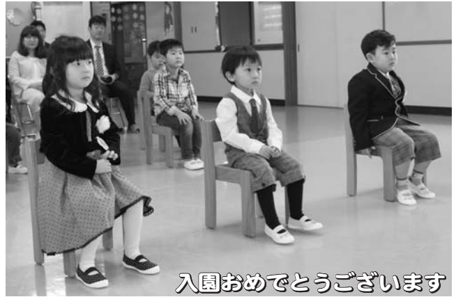
入園おめでとうございます

▲春の火災予防運動にあわせて消防車両が市内を巡回し、火の取り扱いに注意するよう呼びかけました。(4月20日 市内全域)