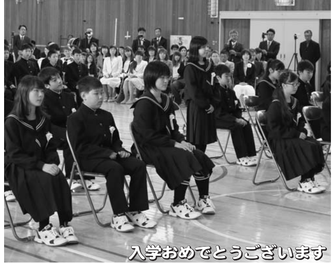
入学おめでとうございます

▲交通事故死ゼロ3,000日を目指し、参加した皆さんは黄色い旗を風になびかせながら、安全運転を呼びかけました。(4月10日 道の駅)