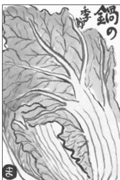
「鍋のおいしい季節」 横山 まり子

▲市立病院と神威地区合同で火災を想定した避難訓練を行い、患者の運搬や避難経路の確認など緊急時に備えました。(9月27日 市立病院)